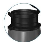
PROLUNGA MODULARE OPZIONALE (PP77)